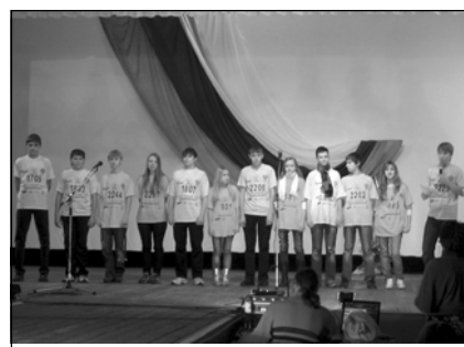
Выступление агитбригады 9 Б класса на районном конкурсе «Классы, свободные от курения»

Зачем же начинать курить? Спросите себя: «Зачем мне это надо?» Если