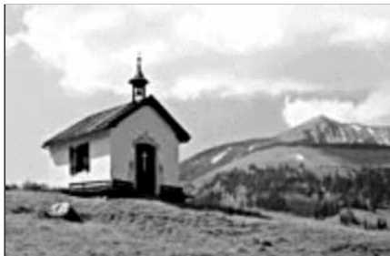
▲ Храм адвентистов

ники, то есть адвентисты, исповедующие свою веру и ведущие соответствующий образ жизни.