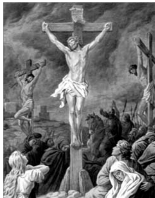
▲ Распятие Христа

поцеловал его, тем самым указав стражникам на него. Иисуса схватили, подвергли побоям и оскорблениям. После этого его привели на иудейский суд, где Иисус подтвердил, что он — Мессия. Его объявили самозванцем, обвинили в богохульстве и приговорили к позорной смертной казни — распятию на кресте. Однако прокуратор Понтий Пилат, римский правитель Иудеи, проникся сочувствием к Иисусу, так как не уви-