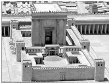
▲ Иерусалимский храм (реконструкция)

Царь Соломон прославился своей великой мудростью и справедливостью в решении самых сложных вопросов. В 945 году он начал строительство Иерусалимского храма, ставшего символом служения еврейского народа Всевышнему.