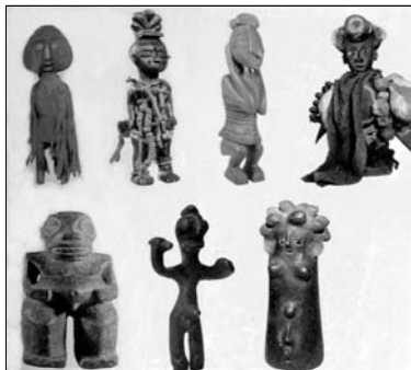
▲ Талисманы и амулеты

Фетишем мог стать любой предмет, который, как считал человек, однажды принес ему удачу. Древние люди верили в то, что фетиш может защищать от болезней, нечистой силы, способствовать успеху на охоте и т. п. Некоторые предметы, обладавшие, как полагали люди, магической силой и оберегавшие своего хозяина от бед и несчастий, стали называть амулетами (с лат. — отстранять, отвращать). Магическую силу приписывали также талисманам (с греч. — посвящение). Различие заключалось в том, что амулеты носили открыто, а талисманы прятали от посторонних глаз. Фетиш мог иметь не только личный, но и общественный характер, то есть оберегать и защищать все племя (гора, дерево, валун и др.). Позднее люди стали создавать искусственные фетиши.