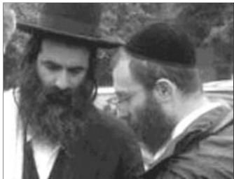
▲ Евреи в традиционных головных уборах

Иудейское богослужение состоит из индивидуальной и общей молитвы, чтения Торы, исполнения религиозных песнопений. Благочестивый еврей молится трижды в день: утром, в полдень и вечером. Основная молитва — «Шма» — состоит из трех библейских отрывков. Молящиеся сидят на креслах, стульях