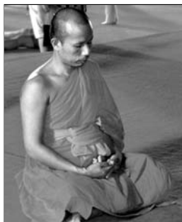
▲ Буддийский монах в состоянии медитации

Особое значение придается телесным останкам и вещам Будды (локон, волосы бровей, часть пепла погребального костра, зуб, чаша для подаяний и др.). Для этих святых стали строить часовни — ступы , круглые