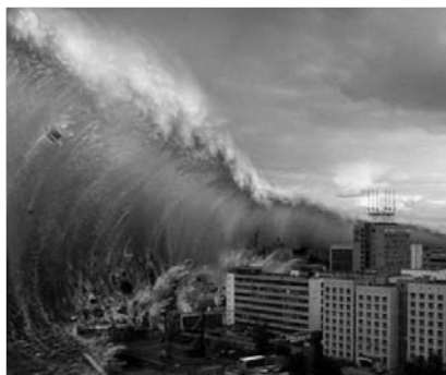
▲ Грозная стихия — цунами

◀ Познавательные причины религиозности обусловлены тем, что с древних времен человека окружали неизвестность, многочисленные необъяснимые явления, он испытывал страх перед грозными, непокорными ему силами природы. Не только в древности, но и сегодня наука не в состоянии дать ответы на многие вопросы об окружающем нас мире. Но пытливый ум человека не согласен мириться с неизвестностью и пытается найти ответы на все нерешенные вопросы. Интерес к необъяснимому, стремление понять его, объяснить наличием сверхъестественных сил создают благоприятные причины для появления религиозности.