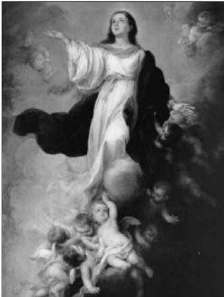
▲ Б. Э. Мурильо. Вознесение Богородицы

нежные пожертвования нередко приводила к значительным злоупотреблениям. Торговля индульгенциями обогатила церковь, но подорвала ее духовный авторитет.