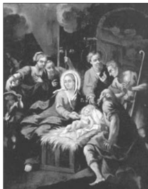
▲ Рождение Иисуса. Миниатюра неизвестного автора

На восьмой день после рождения, согласно иудейскому закону, мальчика понесли в Иерусалимский храм для посвящения Богу. Вскоре несправедливый и жестокий царь Ирод узнал о приходе в мир Мессии и, чтобы погубить его, приказал убить всех младенцев, родившихся в окрестностях Вифлеема. Родители с маленьким Иисусом бежали в Египет. Когда же Ирод умер, семья вернулась в родные края, в город Назарет. Свои детские и юношеские годы Иисус провел в этом городе, поэтому его часто называют Назарянином.