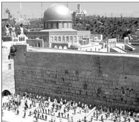
▲ У Стены Плача в Иерусалиме

Ныне от Иерусалимского храма — одного из самых величественных религиозных сооружений в истории человечества — сохранилась только часть западной стены, известная во всем мире как Стена Плача. Сегодня множество людей — жителей Израиля и приезжих