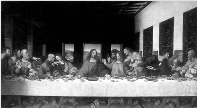
▲ Леонардо да Винчи. Тайная вечеря (фреска)

Так началась последняя неделя земной жизни Иисуса Христа — Страстная , или Великая . Каждый ее день имеет особый смысл и особое значение для всех верующих-христиан.