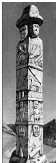
▲ Збручский идол

Осваивая новые территории Восточно-Европейской равнины, восточные славяне практически не встречали естественных преград, что облегчало им продвижение. В ходе своего развития и расселения они вступали в тесные контакты