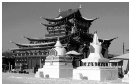
▲ Иволгинский дацан в Бурятии

В 1930-е годы в СССР действовало 47 бурятских дацанов, в которых проживало около 10 тысяч лам и послушников, 28 калмыцких монастырей (3 тысячи духовных лиц), 19 тувинских монастырей (3 тысячи лам и послушников).