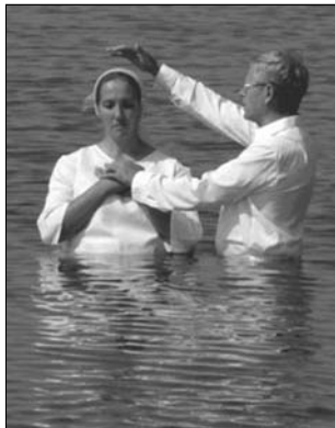
▲ Крещение баптистов

5. Адвентизм В 30-х годах XIX века от баптизма отделилось новое протестантское направление — адвентизм (с лат. — пришествие). сторонники его называют себя «Адвентисты седьмого дня». В основе их веры лежит учение о конце света. Адвентисты утверждают, что наш мир вскоре будет уничтожен огнем, а для верующих будет создана новая земля. Основным догматом адвентистов — догмат о скором пришествии на землю Иисуса Христа. После второго пришествия Христа произойдет воскресение людей, но воскреснут только правед-