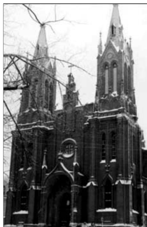
▲ Католический храм в Смоленске

При императоре Александре I в 1820 году за активную пропаганду католицизма была запрещена деятельность ордена иезуитов в России. В 1847 году, при Николае I, подписан конкордат (с лат. — нахожусь в согласии), то есть государственный договор между Россией и Римом, значительно расширявший власть папы над католическим духовенством в России. Но после подавления Польского восстания (1863—1864 гг.) все отношения российского государства с Римом были разорваны.