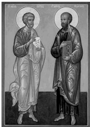
▲ Апостолы Петр и Павел (икона)

Время шло, и сторонников христианства постепенно становилось все больше. Римский император Константин I, мудрый и дальновидный политик, увидел в христианстве возможность укрепить свою власть, ведь оно призывало народ подчиняться властям и признавало власть одного правителя. В 311 году Константин I объявил христианство законным, и гонения на христиан прекратились. С 313 года любой житель империи по своему желанию свободно мог перейти в христианскую религию. В 324 году христианство провозглашается господствующей религией Римской империи, однако новая вера утвердилась не сразу, особенно на окраинах. Так, только в конце IV века при императоре Феодосии I Вели-