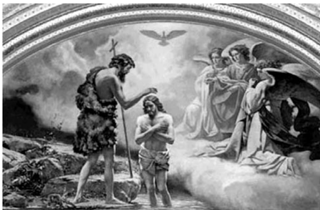
▲ Крещение Иисуса Христа. Фрагмент росписи храма Христа Спасителя, авт. воссоздания К. И. Нестеренко

Затем Иисус на 40 дней удалился в пустыню и предался молитве, размышлению и посту. Во время поста его искушал Сатана, обещая за отступничество все блага