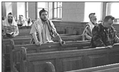
▲ Еврейская хоральная синагога в Москве

В современной России иудаизм представлен тремя крупными течениями: ортодоксальным иудаизмом, хасидизмом, современным иудаизмом. Наиболее влиятельны