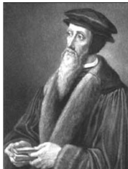
▲ Жан Кальвин

Почему же Реформация имела большой успех? В XVI веке феодальные отношения в Европе переживали глубокий кризис. Нарождались новые, капиталистические, общественные отношения, в которых главным становился человек свободный, инициативный, предприимчивый. Католическая же церковь защищала старые порядки и по-прежнему придерживалась требования полного духовного контроля над верующими.