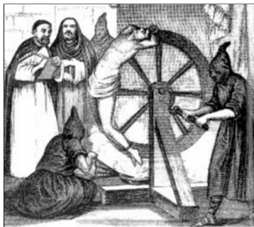
▲ Пытка обвиняемого в инквизиции

Инквизиторы подчинялись Папе Римскому, только он мог изменить вынесенный ими приговор. «Пособием» инквизиторов была книга «Молот ведьм», в которой со ссылками на Священное Писание доказывалась необходимость жесточайшей расправы с еретиками, колдунами, ведьмами. Обвинению, пыткам и казни подвергались не только про-