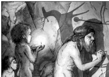
▲ В первобытной пещере

На чем было основано магическое мышление? Ученые выделяют два закона, которые лежали в основе его: закон подобия и закон заражения.