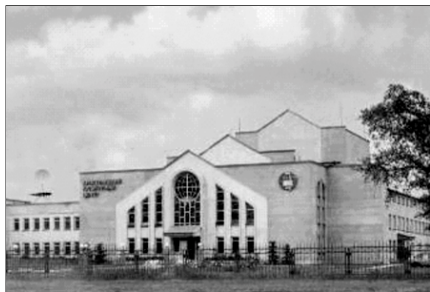
▲ Центр адвентистов в Нижнем Новгороде

◄ Адвентисты. Первая в России община адвентистов была образована в Крыму в 1886 году среди немецких колонистов, а русская община появилась в 1890 году в Ставрополе. Однако против учения адвентистов выступили православная церковь, баптисты и лютеране.