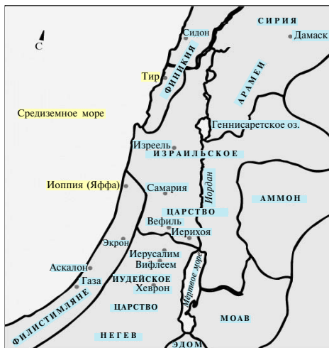
▲ Древняя Палестина, 800 до н. э.

Что происходило с человечеством до возникновения еврейского народа? Согласно библейской истории, первым человеком был Адам. Бог из ребра Адама сотворил Еву, его жену. Первые люди жили в раю и ни в чем не нуждались. Но, как известно, поддавшись на уговоры Сатаны, явившегося им в образе змея, они вкусили запретный плод с дерева познания и потеряли доверие Бога, своего Создателя. В наказание они были изгнаны из рая на землю, где им пришлось самим строить свою трудную, полную лишений и страданий жизнь. Сын Адама и Евы Каин совершил страшный грех — братоубийство. Брат Авель пал жертвой зависти Каина. С каждым поколением люди все больше отдалялись от Бога, совершали все больше тяжких грехов. И наконец Бог решил уничтожить человечество, погрязшее в грехе и пороке. Воды Великого потопа погубили всех людей. Только семья праведника Ноя получила спасение. Ной должен был стать родоначальником нового человечества, которое Бог обещал не уничтожать. Однако зло не исчезло из жизни людей, и они вновь отвернулись от Бога. И тогда Бог заключил союз с Авраамом — договор о рождении нового, богоизбранного народа.