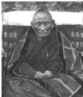
▲ Хамбо-лама Агван Доржиев

лаем II ему удалось добиться согласия государя на строительство в Петербурге буддийского храма. Проект храма был подписан архитектором Г. В. Барановским, но работал над ним сам Доржиев.