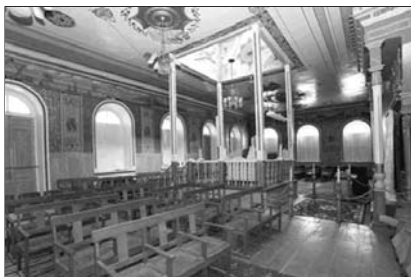
▲ Синагога в Дербенте

Человек, возглавляющий автономную еврейскую религиозную общину, называется раввин . Становление института раввинов происходило в Средневековье, когда местные еврейские общины начали самостоятельно избирать себе духовного руководителя. Ему присваивалось это звание, которое указывало на ученость и авторитет избранного.