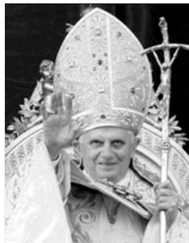
▲ Папа Римский Бенедикт XVI

Вселенская церковь состоит из отдельных церквей — территориальных сообществ католиков, границы которых