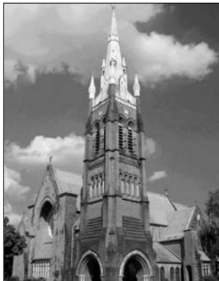
▲ Здание англиканской церкви

церковной организации. Эта «реформация сверху» привела к установлению некой «средней линии» в новой религии между католичеством и протестантизмом. В англиканской церкви, как и в католической, сохраняется церковная иерархия. В ней главенствуют два архиепископа: Кентерберийский и Йоркский. Архиепископ Кентерберийский считается примасом (первым) — фактическим главой англиканской церкви. Формально же в ней главенствует король или королева. Особенностью англиканства является то, что идея о спасительной роли церкви (утверждаемая католицизмом) сочетается в нем с идеей о спасении личной верой (которую отстаивает протестантизм).