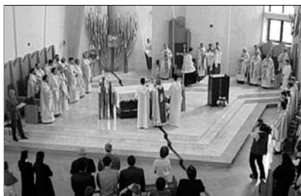
▲ В католическом храме

стулья, на которых молящиеся сидят во время службы. Священник провозносит свою проповедь со специального возвышения — кафедры . В каждом храме обязательно отведено особое место для исповеди — конфессионал , или исповедальня .