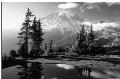
▲ Как прекрасен этот мир...

Жизнь верующего человека наполнена религиозными представлениями (о Боге, Царстве Божием), чувствами (восхищения, удивления), эмоциями, настроениями (положительными, отрицательными).