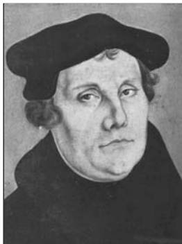
▲ Мартин Лютер

индальгенций». 31 октября 1517 года Мартин Лютер прикрепил этот документ к дверям университетской церкви в Виттенберге.