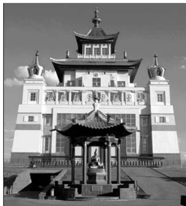
▲ Буддийский храм

Во время молебна читаются молитвы и тексты священных книг, проводятся очистительные ритуалы, об-