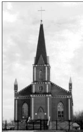
▲ Баптистский храм в Нижнем Новгороде

В 1992 году создается Федерация союзов евангельских христиан-баптистов, одним из членов которой стал Союз евангельских хри-