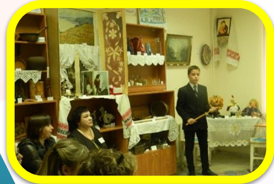
Семейный клуб «Мир вашему дому»