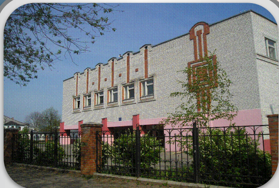
МБОУ “СОШ №6 им. К. Минина”