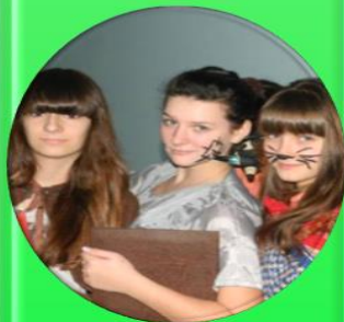
Годовой круг традиционных дел