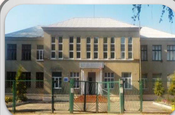
МБОУ “СОШ №18”