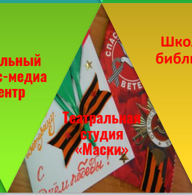
Театральная студия «Маски»