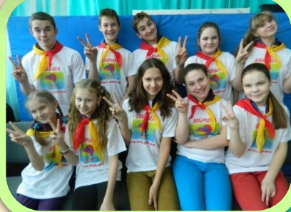
Школьный музей «Искорки памяти»