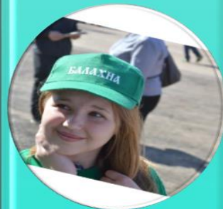
Система дополнительного образования