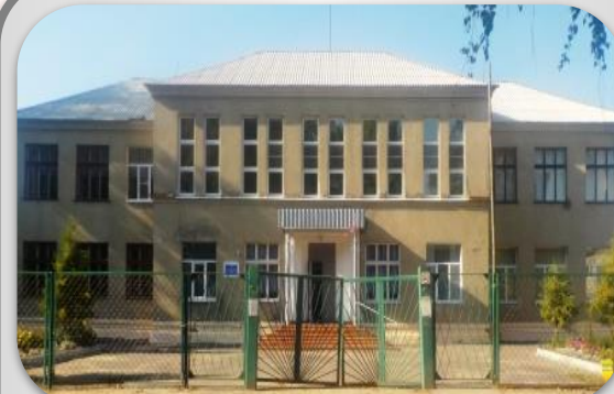
МБОУ «СОШ №18»