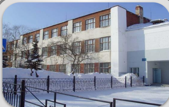
МБОУ “СОШ №12”