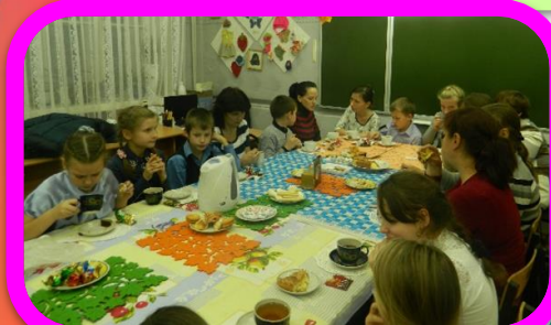
Волонтерское объединение «Добродеи»