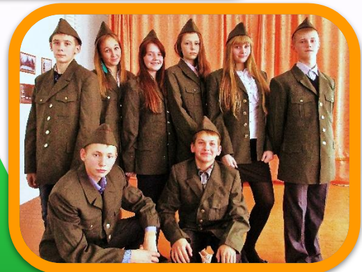
Поисковый отряд «Память»