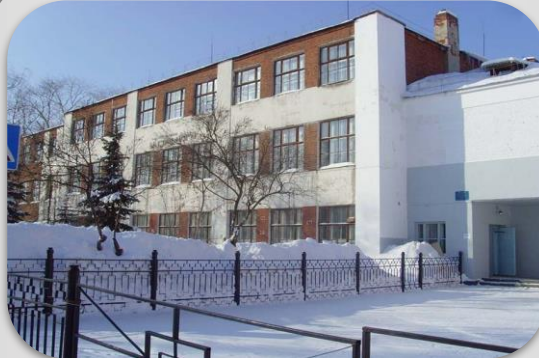
МБОУ «СОШ №12»