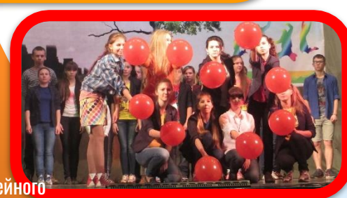
Клуб семейного общения, семейный YouTube-канал