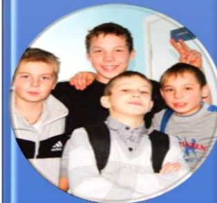
Направления воспитательной деятельности