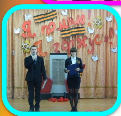
Вокальная студия «Веселые нотки», «Звездочки»