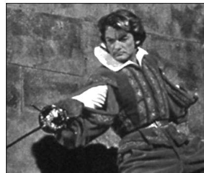
Жан Марэ в фильме «Парижские тайны»

мьер 2009 года «Возвращение мушкетеров».