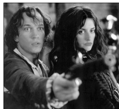
Венсан Перес и Пенелопе Крус в фильме «Фанфан-Тюльпан»

В 1993 году на экраны выходит фильм «Аромат любви Фанфан» с Венсаном Пересом в главной роли. В этой романтической комедии персонажа по имени Фанфан играет... Софи Марсо. В 1994 году черту под жанром «плаща и шпаги» подвел фильм «Королева Марго». Режиссер Патрис Шеро ясно продемонстрировал, что французы времен Генриха Наваррского, да и Людовика XIV были народом кровожадным, жили в грязи и убивали друг друга за просто-