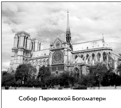
Собор Парижской Богоматери

Первый уровень — самый комфортный для того, чтобы просто провести там время. Он представляет собой довольно обширную площадку вокруг всего «тела» башни: там есть кафе и платные телескопы, отсюда же можно сделать серию снимков