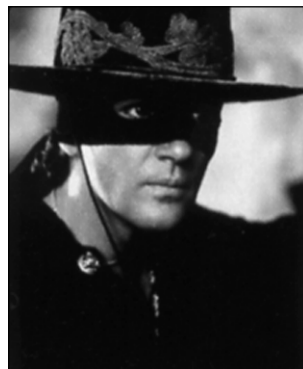
Антонио Бандерас в фильме «Маска Зорро»

А что же кино? Примерно в это же время фильмы «плаща и шпаги» переживают второе рождение. В Голливуде входят в моду римейки, и теперь Антонио Бандерас становится Зорро, Крис О'Доннелл — д'Артаньяном, Леонардо ди Каприо — Людовиком XIV. Поразитель-но, но эта римейкомания захватила и перерезавшего всех и вся Жерара Депардье, который надевает нос Сирано де Бержерака. Затем у д'Артаньяна обнаруживается дочь, а в России находится место «Мушкетерам 20 лет спустя» и пре-