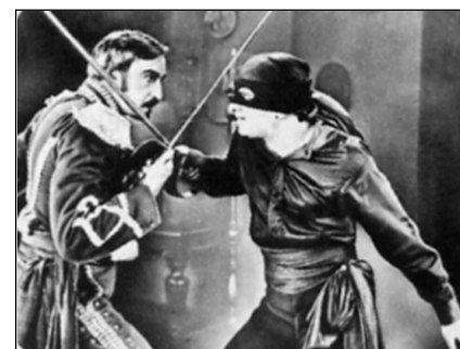
Даглас Фербенкс (справа) в роли Зорро