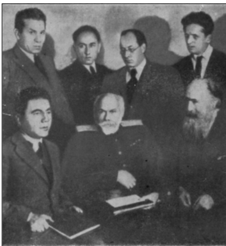
Группа армянских ученых — академиков АН СССР (Москва, 1947 г.) (В. Амбарцумян сидит слева)

В 1946 году по инициативе Виктора Амбарцумяна на южном склоне горы Арагац началось строительство сегодня уже всемирно известной Бюраканской астрофизической обсерватории. Была проложена асфальтированная дорога к вершине горы Арагац и построена высоковольтная линия передачи электроэнергии. Одними из первых в республике были газифицированы ближайшие населенные пункты с тем, чтобы дым не мешал астрофизическим наблюдениям. Поэтому небо над Бюраканом очень чистое, воздух сухой (южный склон горы), а звезды и весь